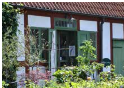
Trädgårds- och inredningsbutiken Flora Linnea är specialiserad på rosor. Den är inrymd i Fredriksdals gamla prästgård.

Eftersom vi älskar rosor inser vi att det skapas roshistoria även i vår tid. Därför har rosariet kompletterats med vår tids moderna rosor, ordnade efter färg och samplanterade med perenner som framhäver dem.