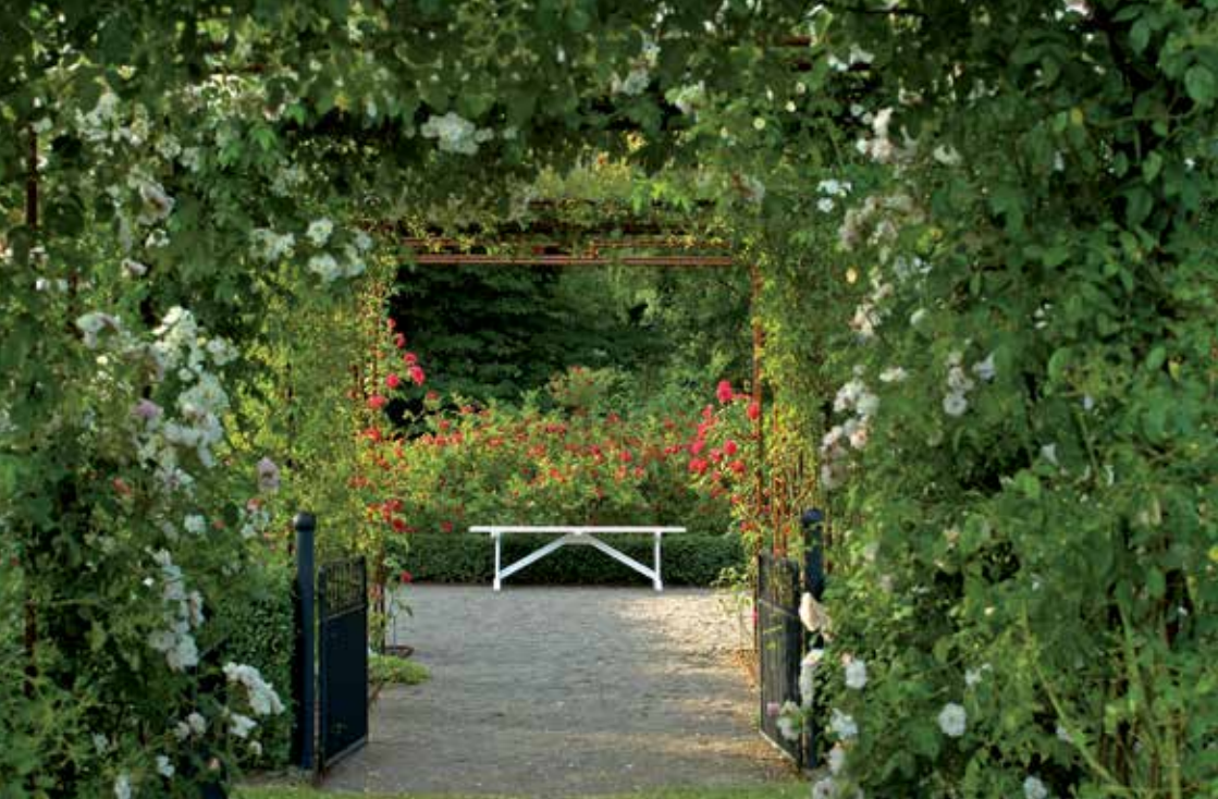
Fredriksdals rosarium innehåller 170 gammaldags rosor och närmare 200 moderna rosor.